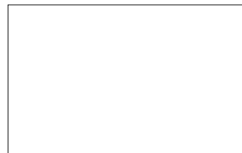
Șină de prindere pe partea frontală