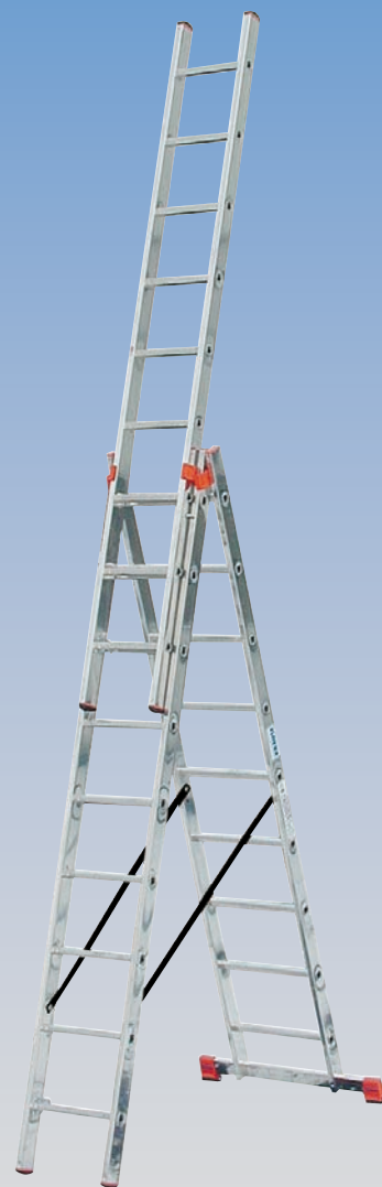
Art. nr. 120601